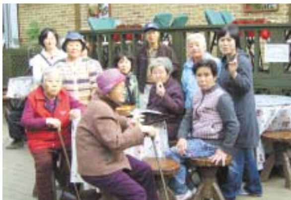
허브나라 식물원에서 허브 향기를 맡으며...

오전 9시에 출발하여 저녁 6시가 되어서야 귀원한 긴 가을 나들이에 피로한 하루였지만 무사히 잘 다녀올 수 있어 하나님께 감사하고 자연을 즐기며 문화유적지 탐방에 보람도 있어 나들이 다녀온 모두에게 기분 좋은 하루였다