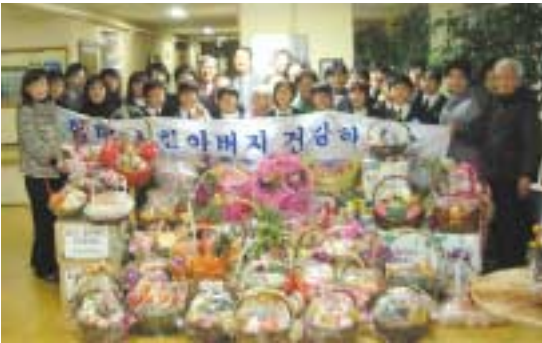
어르신들과 한자리에 모인 대광초등생들

악기 연주와 중창·합창 소리를 들으며 어르신들에게는 어린 시절을 생각하며 동심으로 돌아가 흥겨운 자리가 되었으며, 초등학교 5학년 학생들에게는 어르신들과의 가을 끝자락을 함께 하는 추억을 만드는 시간이었다.