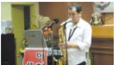
섹소폰 연주를 하고 있는 혼울림 단원

많은 분들이 즐겁고 맛있게 점심식사를 하신 후 3부에서는 초청공연과 웃음치료 및 어르신들의 장기자랑을 뽑내는 시간이 되었다. 올드보이 합주단의 밝고 경쾌한 합주, 이천 혼울림 섹소폰 동우회의 흥겨운 연주와 이에 맞추어 어르신들의 어깨춤과 노래 가락이 어우러지고 박력 있고 유쾌한 정해정 강사의 웃음치료와 함께하는 시간이었다.