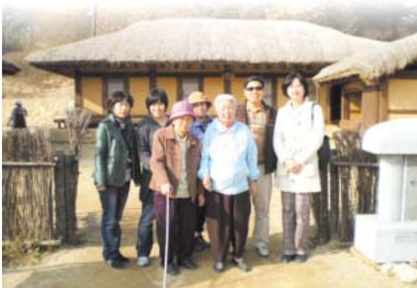
이효석 선생 생가 앞에서

11월 중순 날씨라고는 믿기 어려운 화창하고 따뜻한 날씨 가운데 한나그린힐 어르신, 봉사자, 직원 등 19명이 강원도 봉평에 있는 허브나라와 '메밀 꽃 필 무렵'의 작가 이효석 선생 생가, 그리고 '나는 공산당이 싫어요'라고 항거하며 죽어간 이승복 기념관을 다녀왔다.