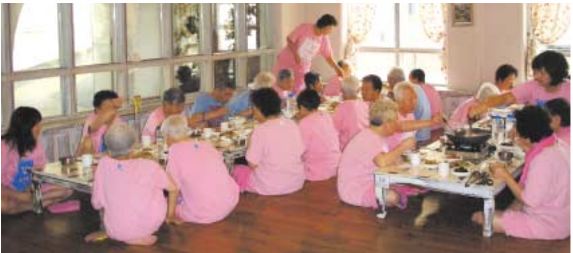
찜질과 온천 후의 맛있는 점심