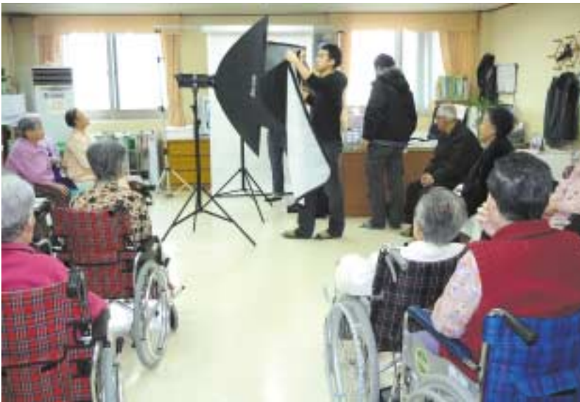
촬영준비를 하는 시니어파트너즈 직원들과 어르신들

(주)시니어 파트너즈는 초 고령화 사회와 정보의 홍수 속에 살고 있는 요즈음 시니어들의 행복한 삶에 기여하려는 큰 비전을 갖고 설립하였으며 나이가 많이 들었거나 질환으로 거동이 불편해 도움이 필요한 노인들에게 정보를 제공하는 것이 주요 사업이다. 특히 노인 장기요양 보험에서 시니어 하우스에 이르기까지 모든 필요한 정보를 제공하고 있다. 또한 기업의 사회 공헌의 일환으로 매월 한차례씩 전국의 노인복지시설을 방문하여 어르신들을 대상으로 건강, 재테크 등을 주제로 한 세미나와 장수사진 촬영 등 봉사 활동을 진행하고 있다.