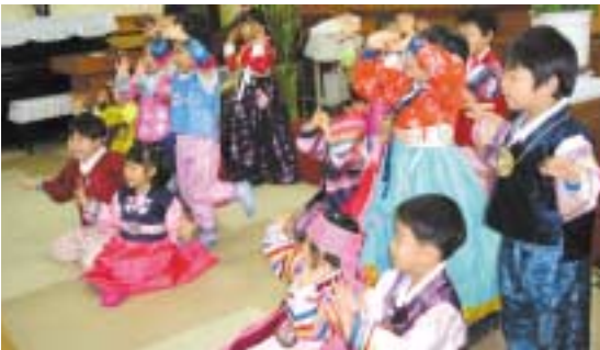
한복을 곱게 차려입고 노래에 맞추어 율동