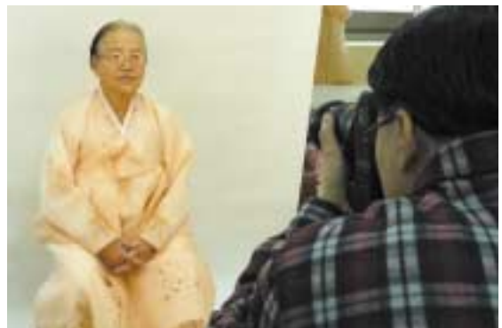
곱게 단장하고 사진촬영을 하시는 어르신들