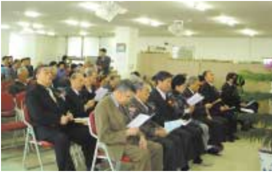
감사예배 드리며 다함께 찬송