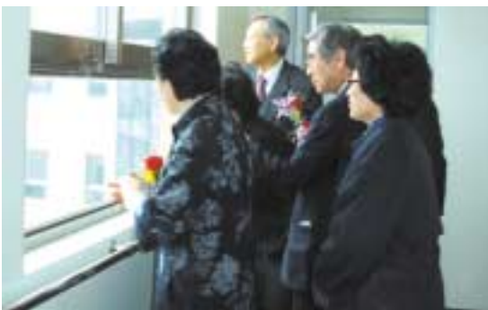
내빈의 증축내부 라운딩