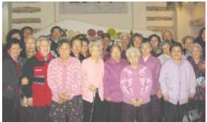
건강나라를 나오면서 기분 좋게 한 컷!

요양원의 인근지역이라 20여분 차량을 타고 도착하여서는 온천과 찜질을 번갈아 하시면서 각자 어르신들의 취향에 맞는 대로 냉찜질과 온찜질의 온도 여하에 따라 골라가며 찜질을 하시면서 즐겁고 기쁜 마음으로 휴식과 안정을 취하며 그동안의 노곤함을 풀어 내셨다. 어르신들은 날씨가 풀리면 또 온천 나들이를 하자면서 아쉬움을 뒤로 하고 다음의 나들을 기약 하셨다