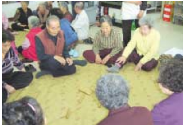
즐겁게 옷놀이 하시는 어르신들