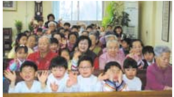
어르신들과 다 같이 한자리에 모여