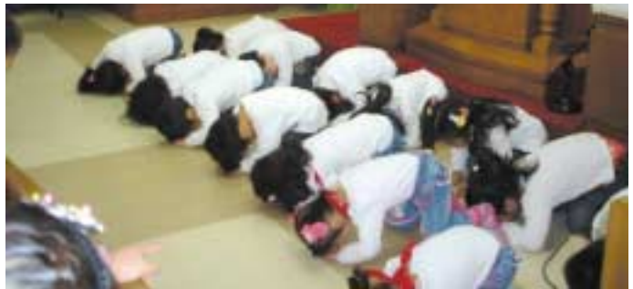
어르신들을 향하여 세배하는 어린이들

어르신들은 잠시나마 어린이들의 공연을 보며 증손자, 증손녀가 생각이 나신다며 흐뭇하게 공연을 바라보았고, 대월어린이집 아이들은 공연이 못내 아쉬웠는지 어르신들에게 마지막 인사할 때도 아주 의젓하고 씩씩한 모습들을 보여 주었다. 많은 아쉬움을 달래며 내년의 공연을 약속하면서 어르신들과 한자리에 모여 단체사진을 찍으며 추억을 담아갔다.